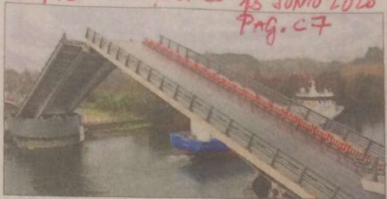
El pasado martes 9, el "Patagón VI" pasó bajo el Cau Cau, puente que elevó sus brazos en poco más de 2 horas, el menor tiempo registrado hasta la fecha.