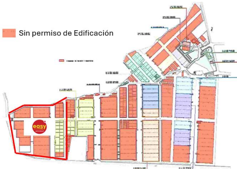
Imagen N°3. FUENTE: DIA "Regularización Centro Logístico Puerto Madero" 3.3 Planta general de Permisos y Recepciones (09.11.2022.)

https://seia.sea.gob.cl/archivos/2023/02/21/Municipalidad_de_Pudahuel.pdf