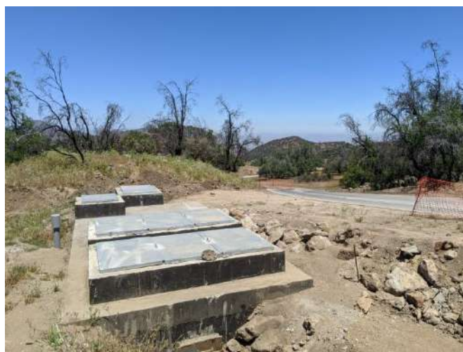
(Coordenadas WGS 84: 33' 17' 13.518" S; 70° 33' 54.882" O)

En la última imagen previamente inserta, puede observarse en el poste una canaleta de color azul la cual contiene los cables que conectan la sentina con el transformador comprendido en la red eléctrica instalada en el predio en el cual se emplaza el referido camino de acceso. Las primeras 4 sentinas del sistema de impulsión siguen esta misma forma de electrificación, mientras que las dos últimas contemplan un generador particular sin que se contemple la conexión a algún generador aéreo. Así, las siguientes imágenes corresponden a las últimas 2 sentinas contempladas en el sistema de impulsión.