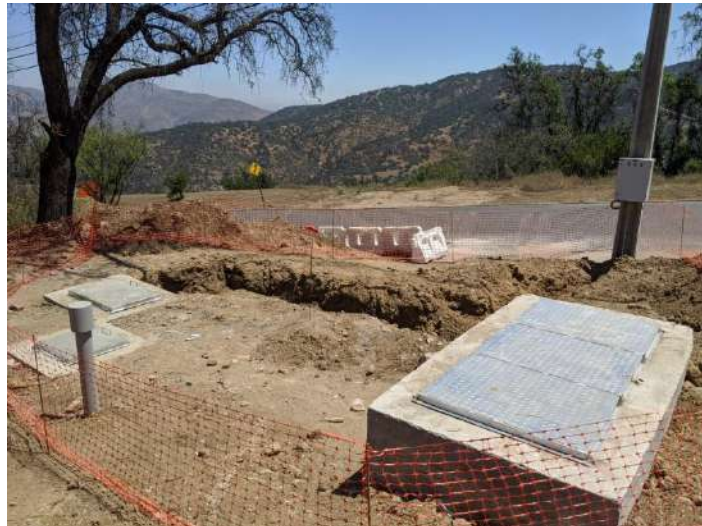
(Coordenadas WGS 84: 33' 17' 17.994" S; 70° 32' 38.13" O)

Por su parte, en las siguientes imágenes se puede observar la parte en superficie de una de las sentinas que forman parte del sistema de impulsión de agua potable que pasa soterradamente por el camino de acceso por hacienda Santa Martina, y que permite llevar el agua desde el estanque de Aguas Manquehue S.A. hasta el primer estanque de acumulación.