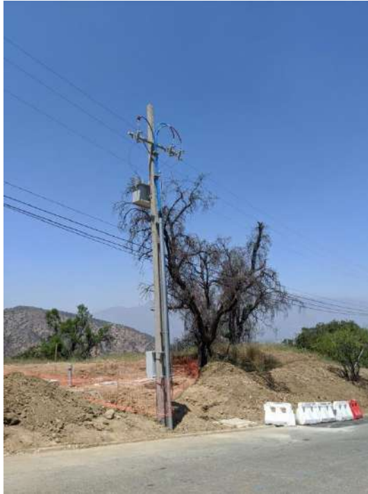
(Coordenadas WGS 84: 33' 17' 17.994" S; 70° 32' 38.13" O)

En la última imagen previamente inserta, puede observarse en el poste una canaleta de color azul la cual contiene los cables que conectan la sentina con el transformador comprendido en la red eléctrica instalada en el predio en el cual se emplaza el referido camino de acceso. Las primeras 4 sentinas del sistema de impulsión siguen esta misma forma de electrificación, mientras que las dos últimas contemplan un generador particular sin que se contemple la conexión a algún generador aéreo. Así, las siguientes imágenes corresponden a las últimas 2 sentinas contempladas en el sistema de impulsión.