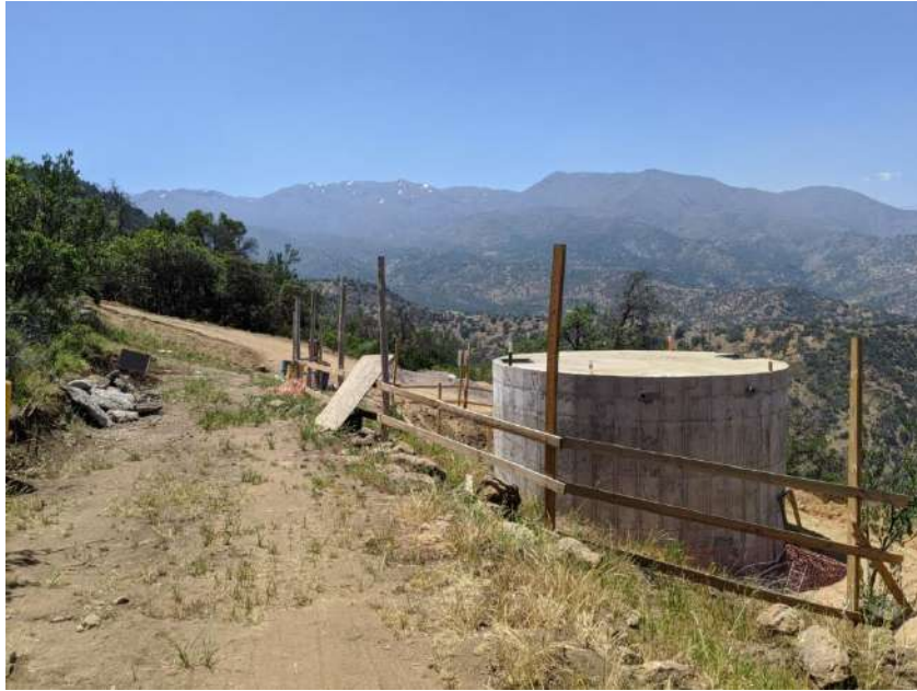
(Coordenadas WGS 84: 33' 17' 13.692" S; 70° 33' 18.876" O)

Por su parte, en las siguientes imágenes se puede observar la parte en superficie de una de las sentinas que forman parte del sistema de impulsión de agua potable que pasa soterradamente por el camino de acceso por hacienda Santa Martina, y que permite llevar el agua desde el estanque de Aguas Manquehue S.A. hasta el primer estanque de acumulación.